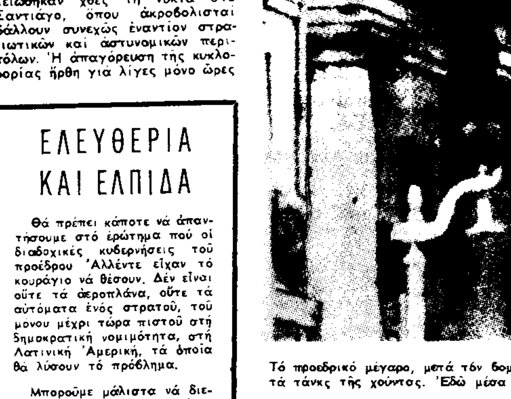
Το προεδρικό μέγαρο, μετά τον βομβαρδισμό του από τα αεροπλάνα και τα tanks της χούντας...