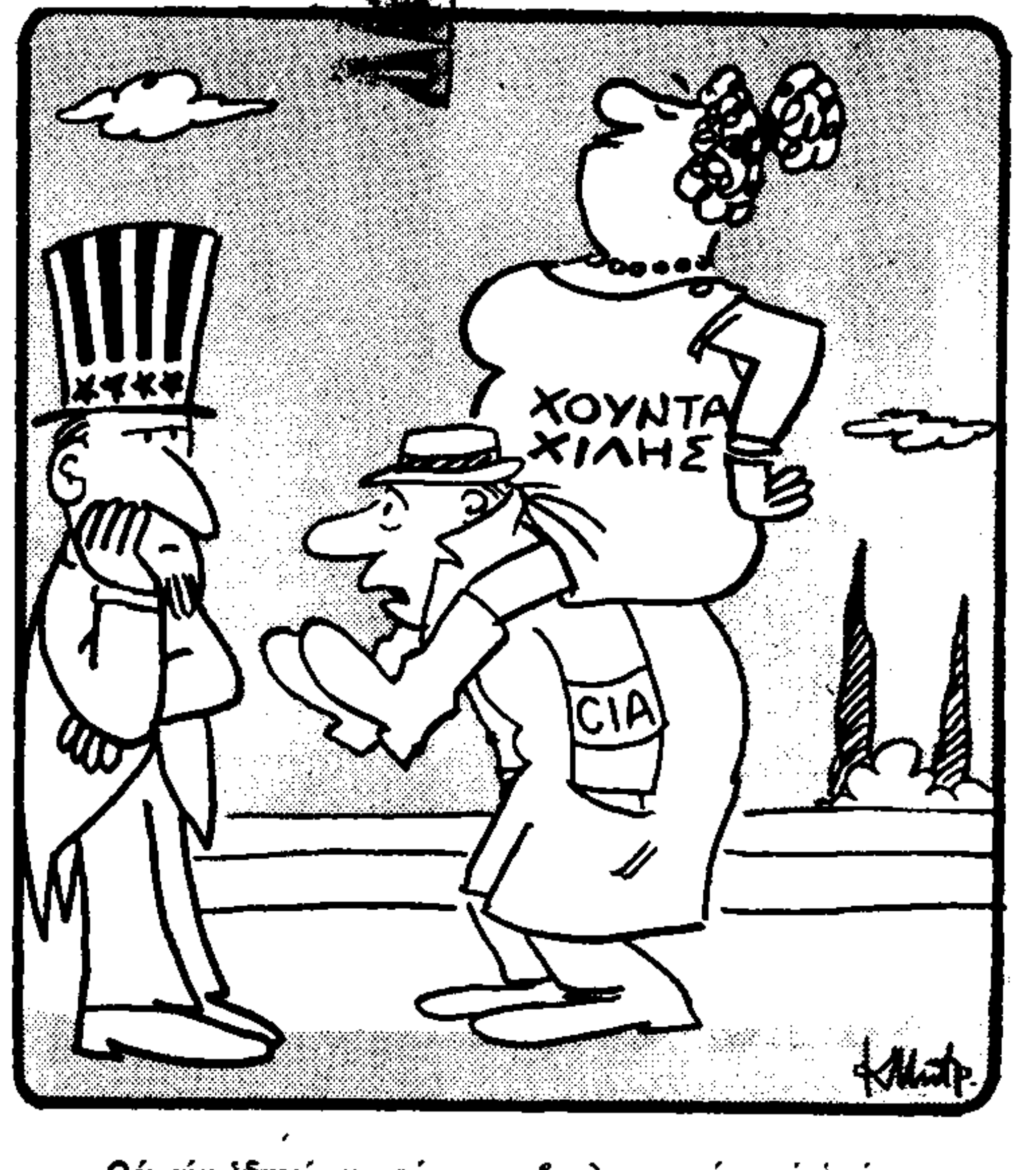
Θά την οδηγήσω στον κοινοβουλευτισμό, στο ύπασμα... (Το Κώστα Μπαρούλιου)