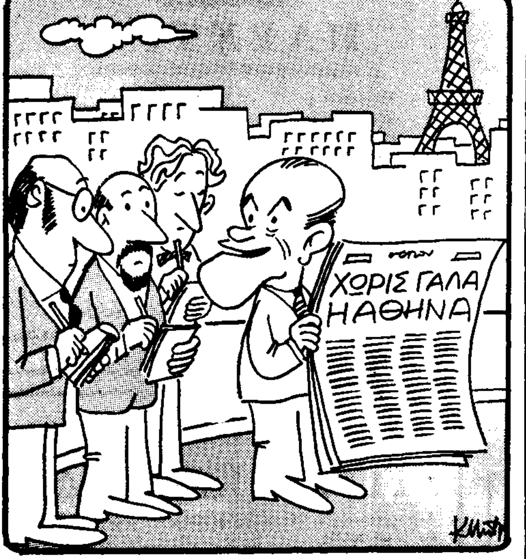
Υποσχόμεθα ελευθερία, δημοκρατία, ισονομία, ισολογισμούς, ελευθεροτυπία, γαλακτοτροφία... (Το Κώστα Μπαρούλιου)